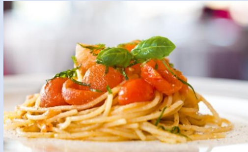
メインダイニング お食事は地中海料理が中心 ※写真はイメージです