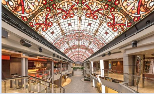
プロムナード 480㎡のLEDドームの2層建て