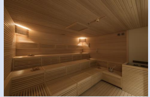
サマーエリア (有料) サウナで整うことができます